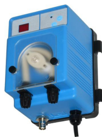
STRUMENTO DI CONTROLLO DEL pH