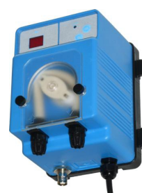
STRUMENTO DI CONTROLLO DEL CLORO TRAMITE IL POTENZIALE REDOX