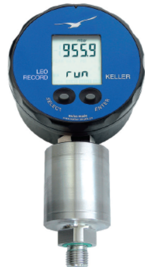
Leo Record Capo