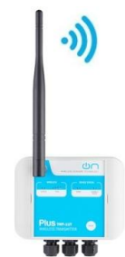
TWP-1UT 1 ingresso temperatura 1 uscita digitale