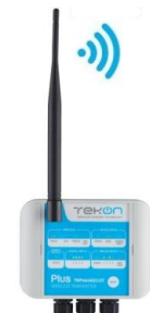
TWP-4AI4DI1UT 4 ingressi analogici 4 ingressi digitali 1 ingresso temperatura 1 uscita digitale