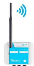
TWP-1AI 1 ingresso analogico 1 uscita digitale