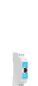
PIM101 Modulo IOT Modbus RTU / TCP/IP