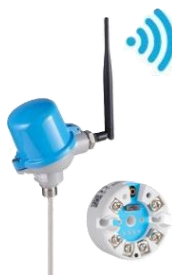
TWPH-1UT 1 ingresso temperatura da testina DIN