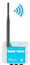
TWP-2AI 2 ingressi analogici 1 uscita digitale