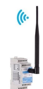
WG420 Ricevitore Gateway wireless Modbus RTU + 8 out 4-20mA