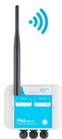
TWP-2UT 2 ingressi temperatura 1 uscita digitale