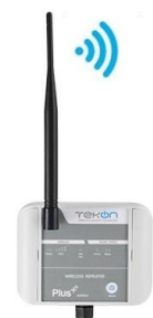
WRP001 Ripetitore sino max 12 ripetitori