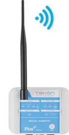
TWP-4AI 4 ingressi analogici 1 uscita digitale