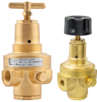
VS114 (1/4") VS138 (3/8")